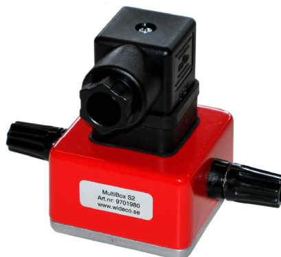
MultiBox S2 (för signalkabel)