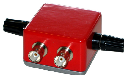
MultiBox C2 (för koaxialkabel)

Snabb anslutning av bärbar testutrustning!