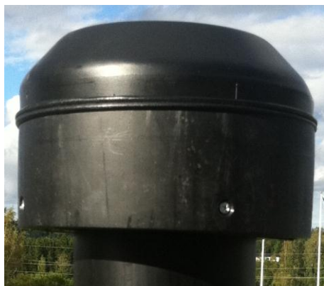
Ventilationshuvud H - modell

Vi kan leverera tjockväggiga krymphylsor för tätning mellan ventilationstorn och gjutjärnrör i mark. Krymphylsorna är invändigt täckta med mastik och levereras individuellt förpackade i skyddsplast, som skyddar mot nedsmutsning innan monteringen.