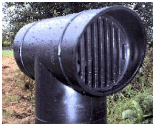
Ventilationshuvud T- modell