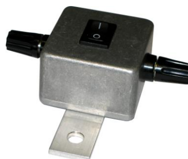
MultiBox M1 för mätplats