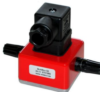
MultiBox S2 (för signalkabel)