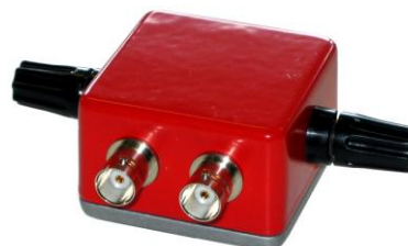
MultiBox C2 (för koaxialkabel)

Portabel utrustning t ex ohmmeter och pulsekometer för manuell mätning kan senare anslutas via banankontakterna. Glöm inte att koppla från eventuell larmenhet.